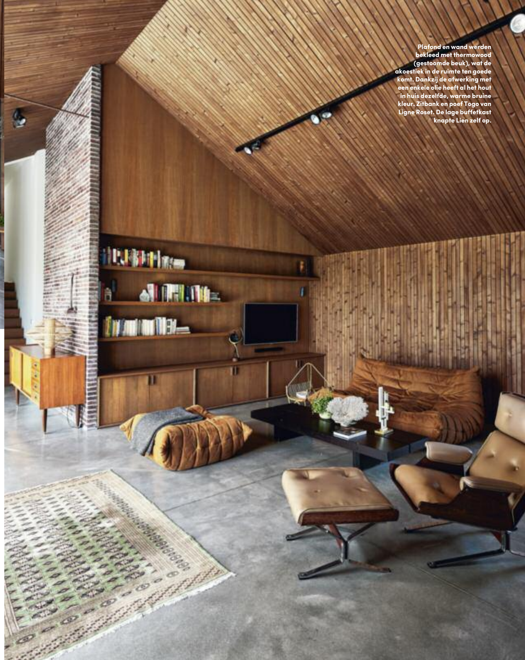
Plafond en wand werden bekleed met thermowood (gestoomde beuk), wat de akoestiek in de ruimte ten goede komt. Dankzij de afwerking met een enkele olie heeft al het hout in huis dezelfde, warme bruine kleur. Zitbank en poef Togo van Ligne Roset. De lage buffetkast knapte Lien zelf op.

Het is opvallend hoe vanzelfsprekend de woning in het landschap opgaat, zeker als je bedenkt dat het gezin er nog maar woont sinds begin vorig jaar. "Het was de bedoeling om de gebruikte materialen binnen en buiten zo mooi mogelijk te laten aansluiten bij de omgeving", legt Lien uit. Dat is aan de buitenzijde goed geslaagd dankzij het gebruik van de Kolumba-gevelsteen: een handgemaakte steen die ook gebruikt werd voor het pad tussen de twee gebouwen van de woning, zodat ze een geheel vormen. De tegelpannen van het dak sluiten er perfect bij aan. Ook de oriëntatie ►