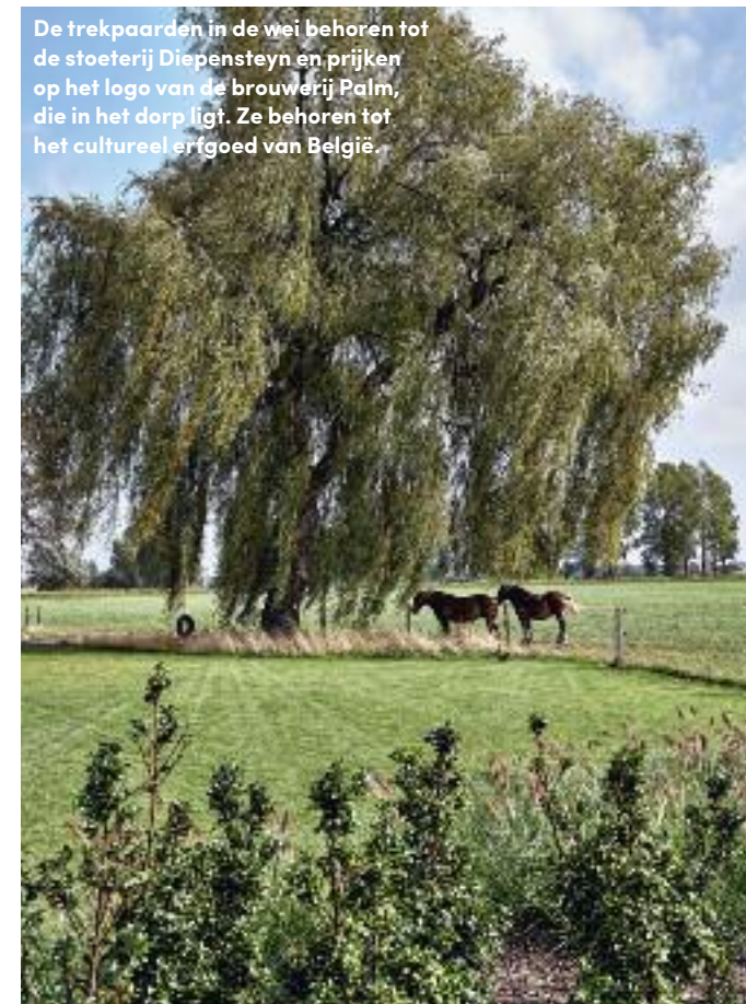
De trekpaarden in de wei behoren tot de stoeterij Diepensteyn en prijken op het logo van de brouwerij Palm, die in het dorp ligt. Ze behoren tot het cultureel erfgoed van België.